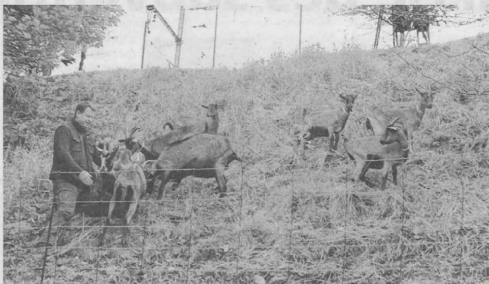
Neuf chèvres tondent actuellement le talus SNCF le long de l'avenue du Val Joyeux.