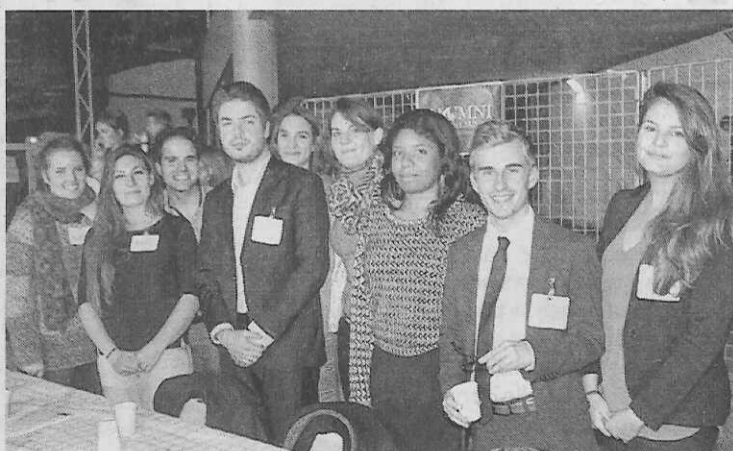
L'équipe des anciens lycéens a lancé son association Alumni Sonia-Delaunay vendredi soir.

L'association va donc mettre en place des conférences à partir de janvier 2016, une par mois et à